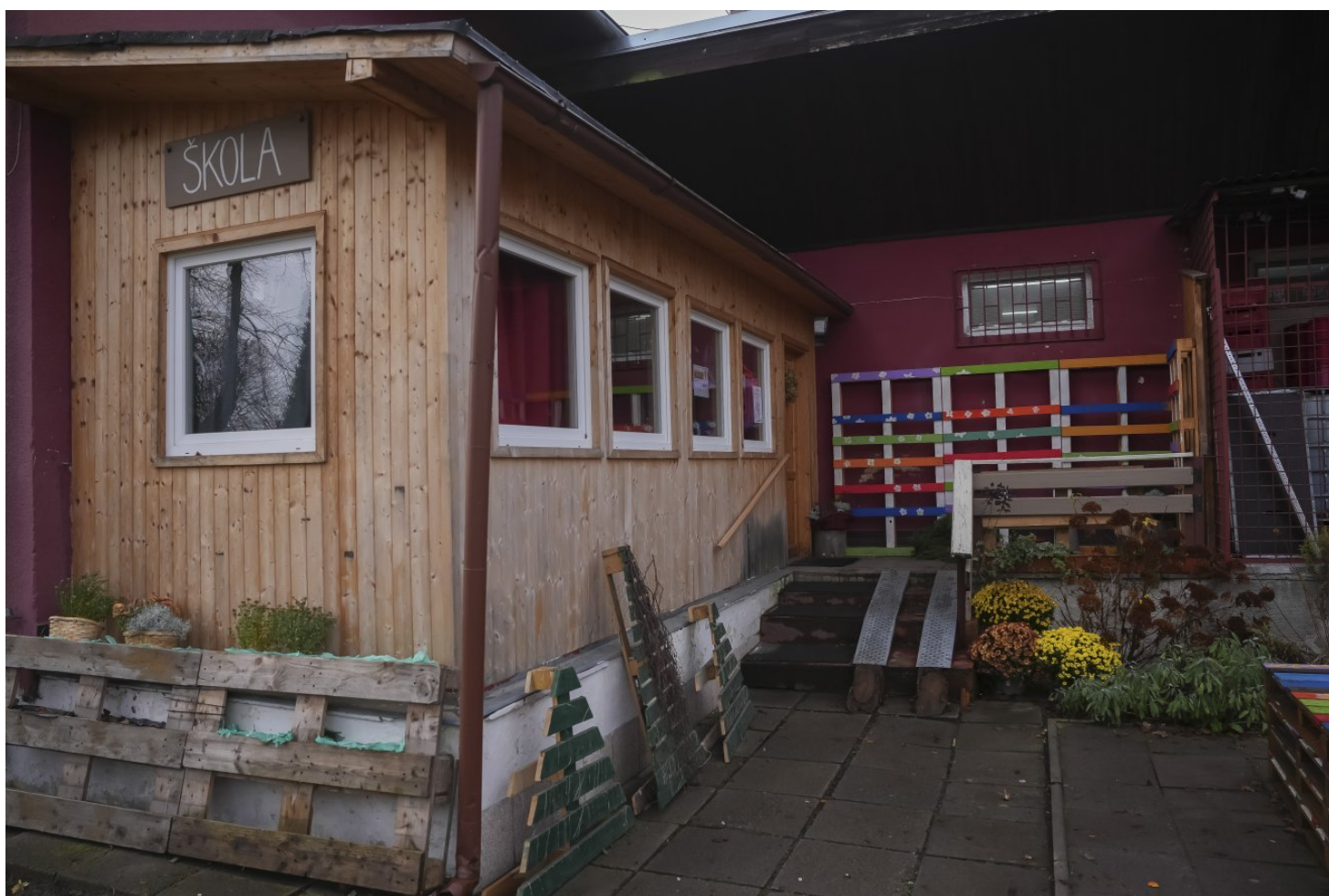
Provizorní budova školy se nachází v místě bývalé restaurace. Tu vlastní majitel přilehlé samoobsluhy.

„Od doby, kdy se tu otevřel druhý stupeň, je provoz strašný,“ popisuje starostka Oken Doubková. Obec aktuálně nástroje na postih špatně parkujících aut nemá. Obecní policie tu není, ta státní k přestupkům často ani nepřijede.