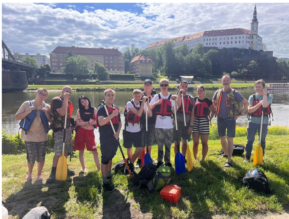
Foto: žáci 9. ročníku na vodáku

Podporovat komunikaci se zákonnými zástupci žáků a dětí.