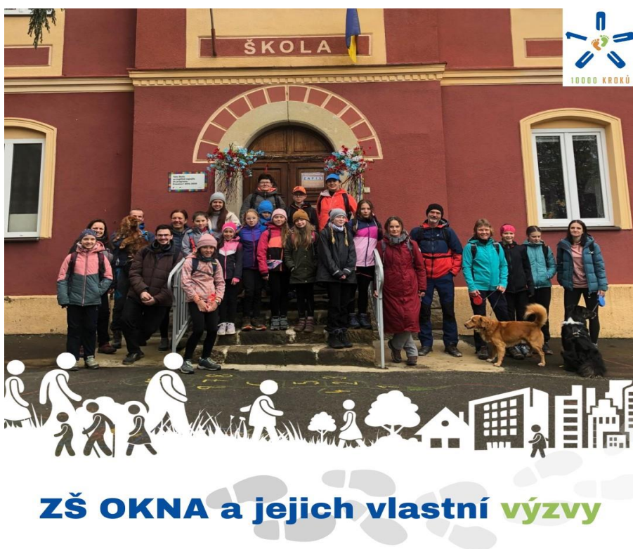
Foto: zapojení do výzvy 10. 000 kroků

Účastnit se akcí pořádaných ostatními školami. Iniciovat spolupráci škol podobného typu (venkovské školy s třídami prvního a druhého stupně).