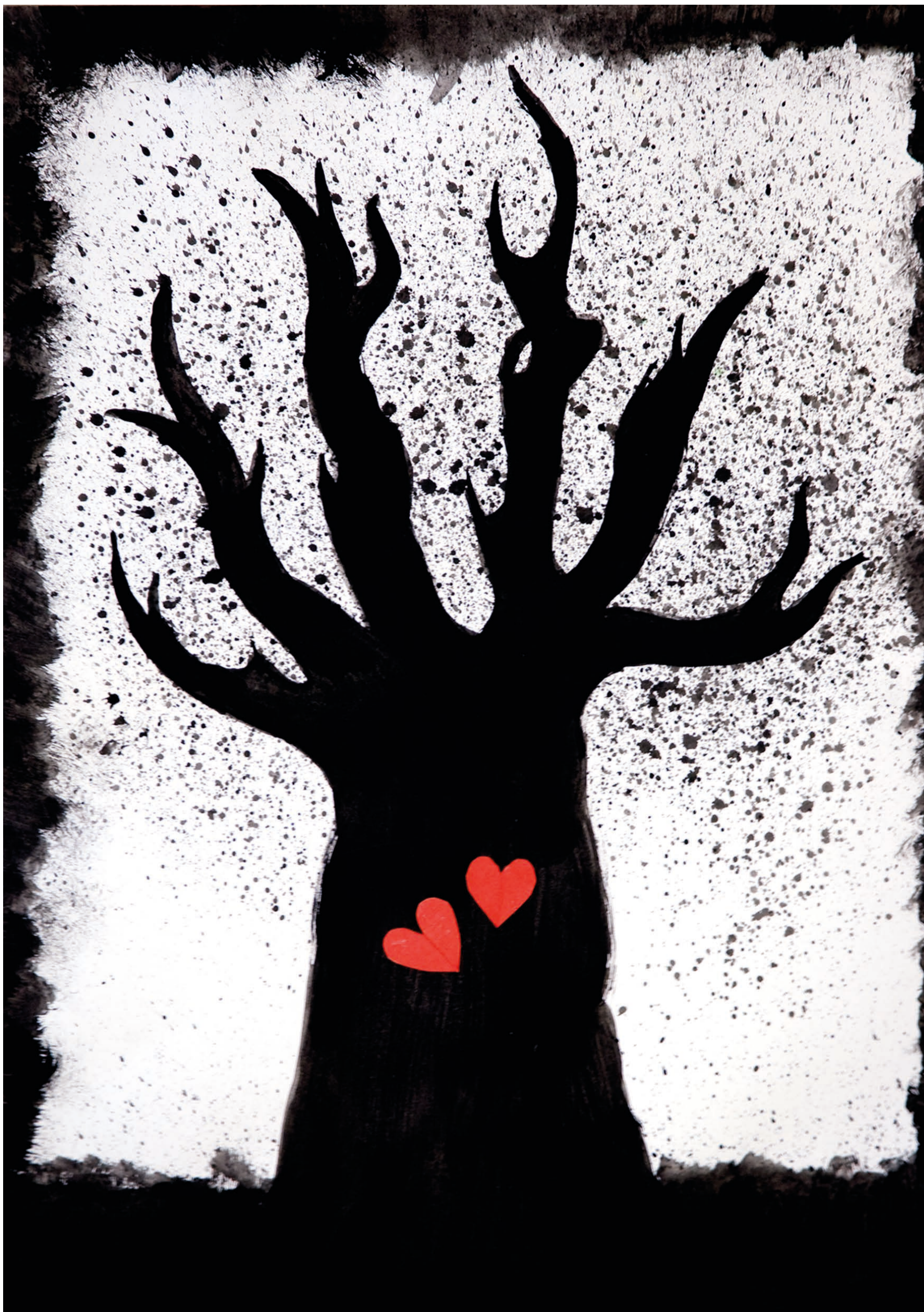
Kristýna Šimůnková, 5. ročník, Sloup v Čechách