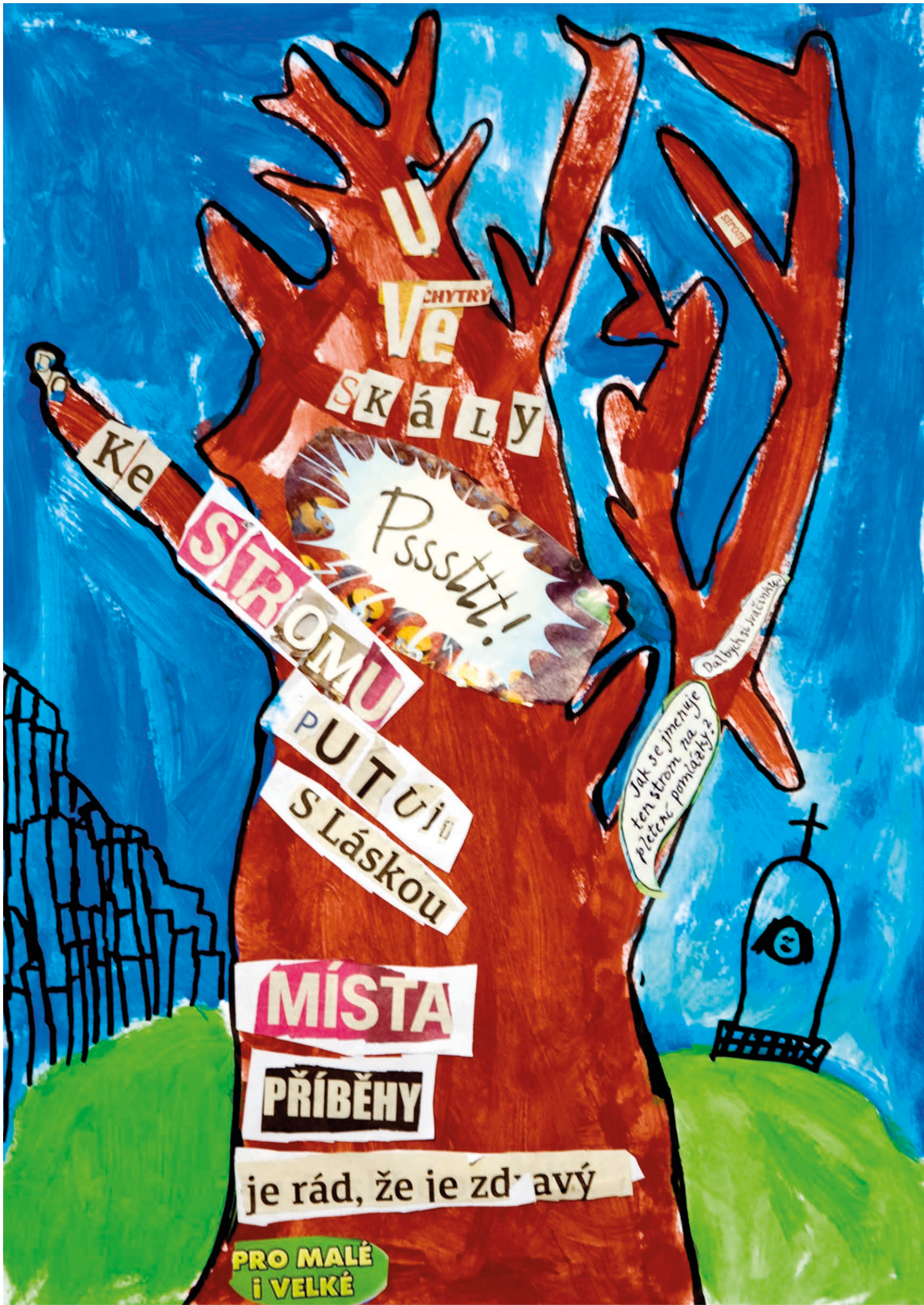
Nikola Wernerová, 3. ročník, Prácheň