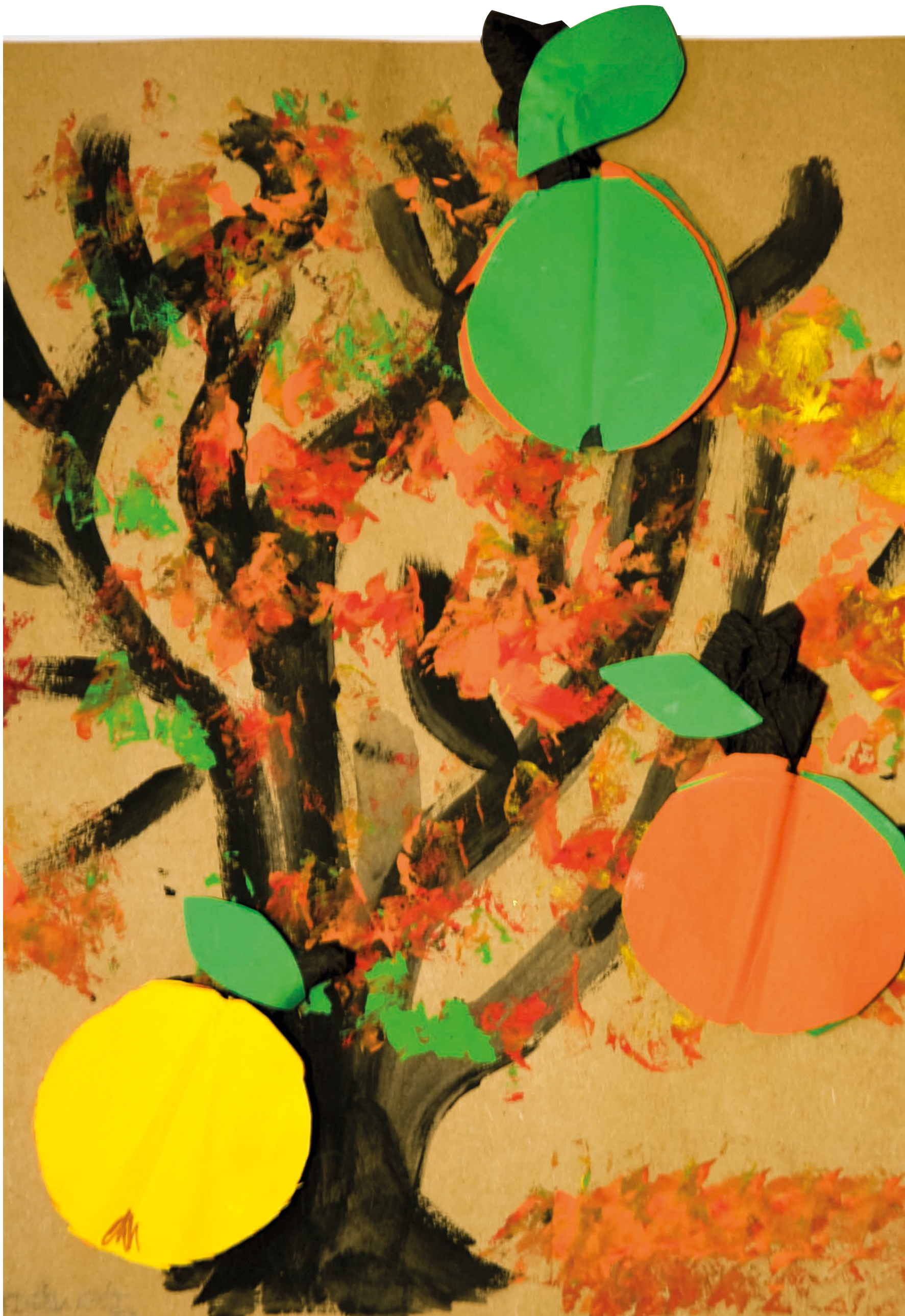
Adéla Slavíková, 1. ročník, Arnultovice