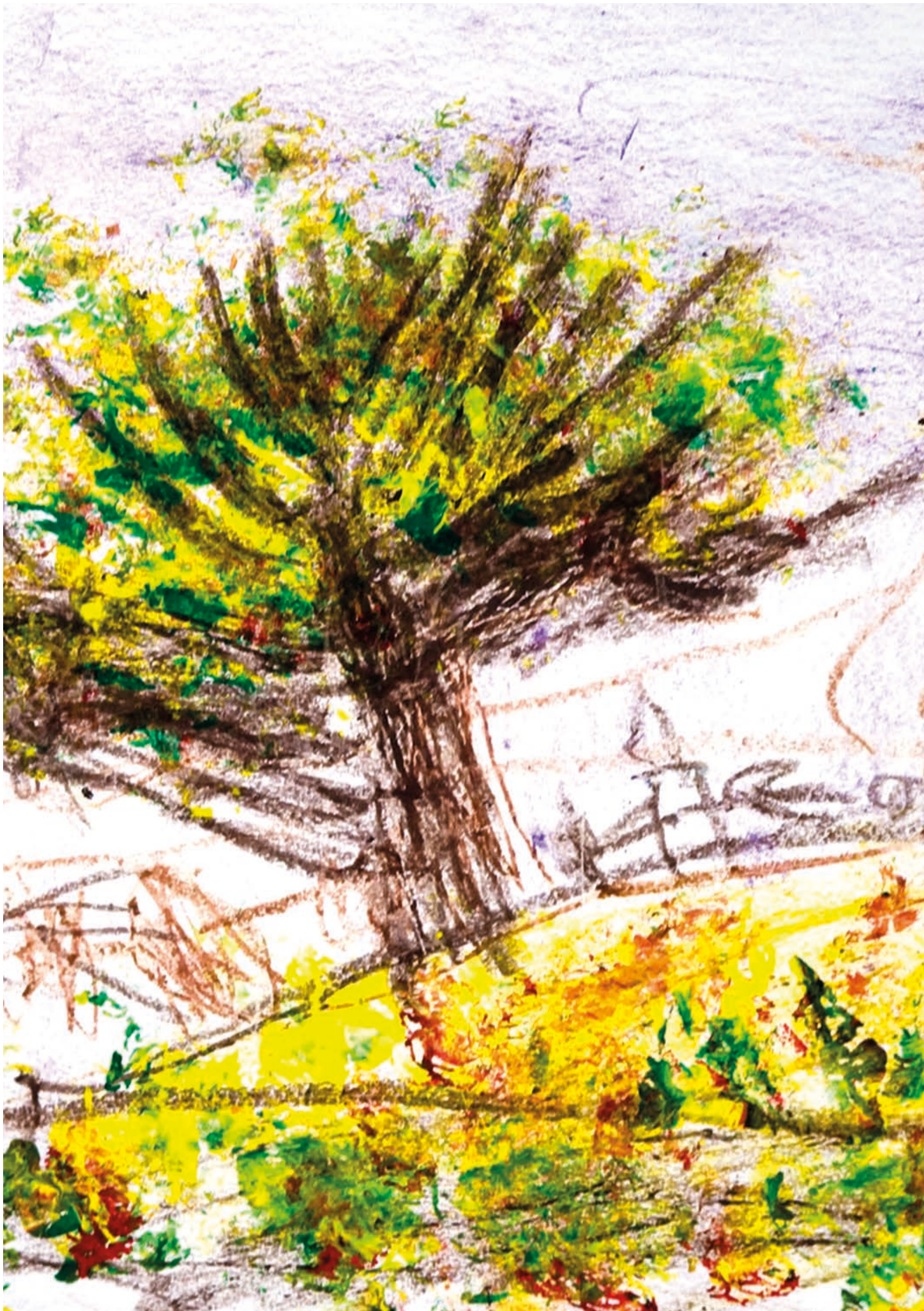
Matěj Zapletal, Mateřská škola (5 let), Okrouhlá