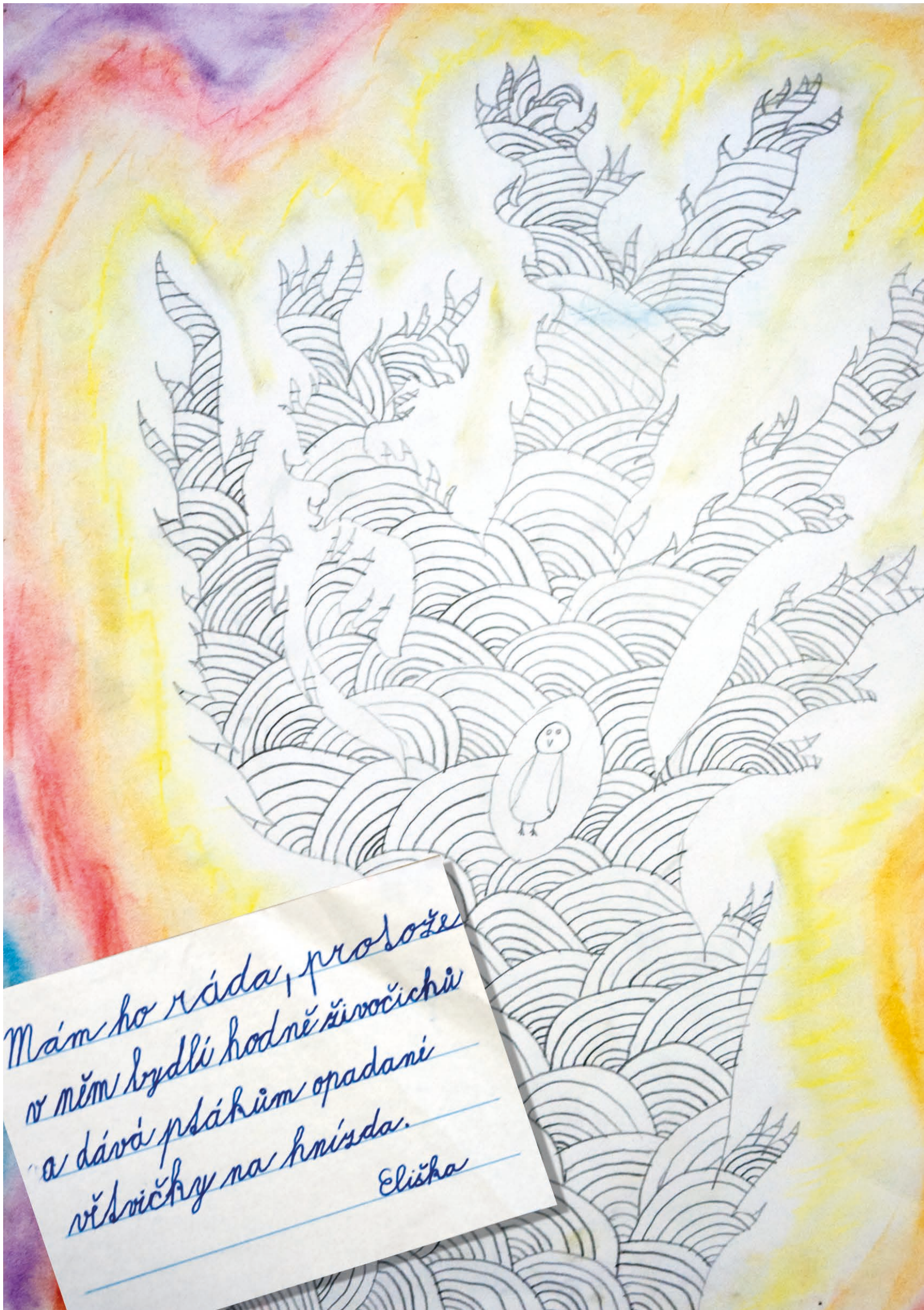
Eliška Patrná, 2. ročník, Volfartice