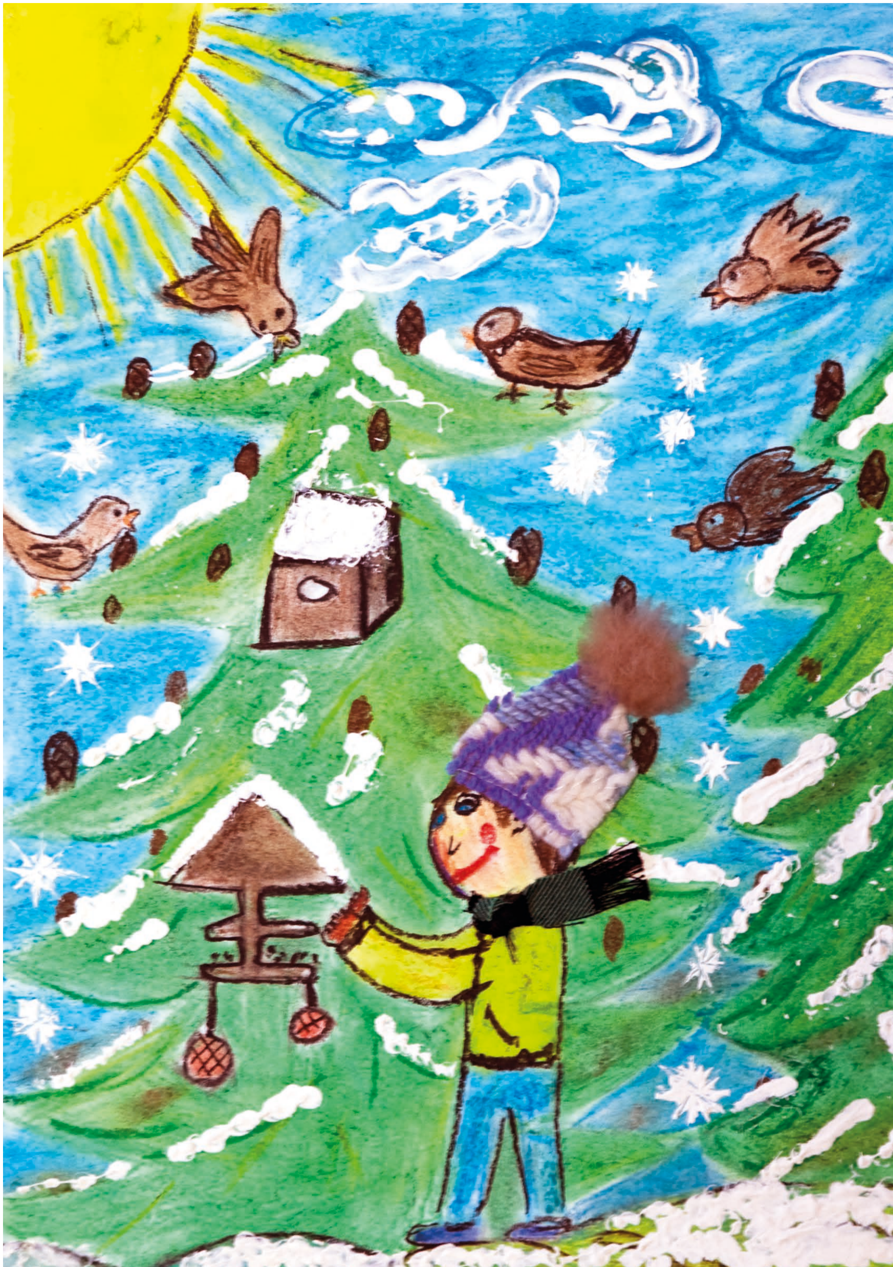
Kristýna Bariová, 4. ročník, Svor