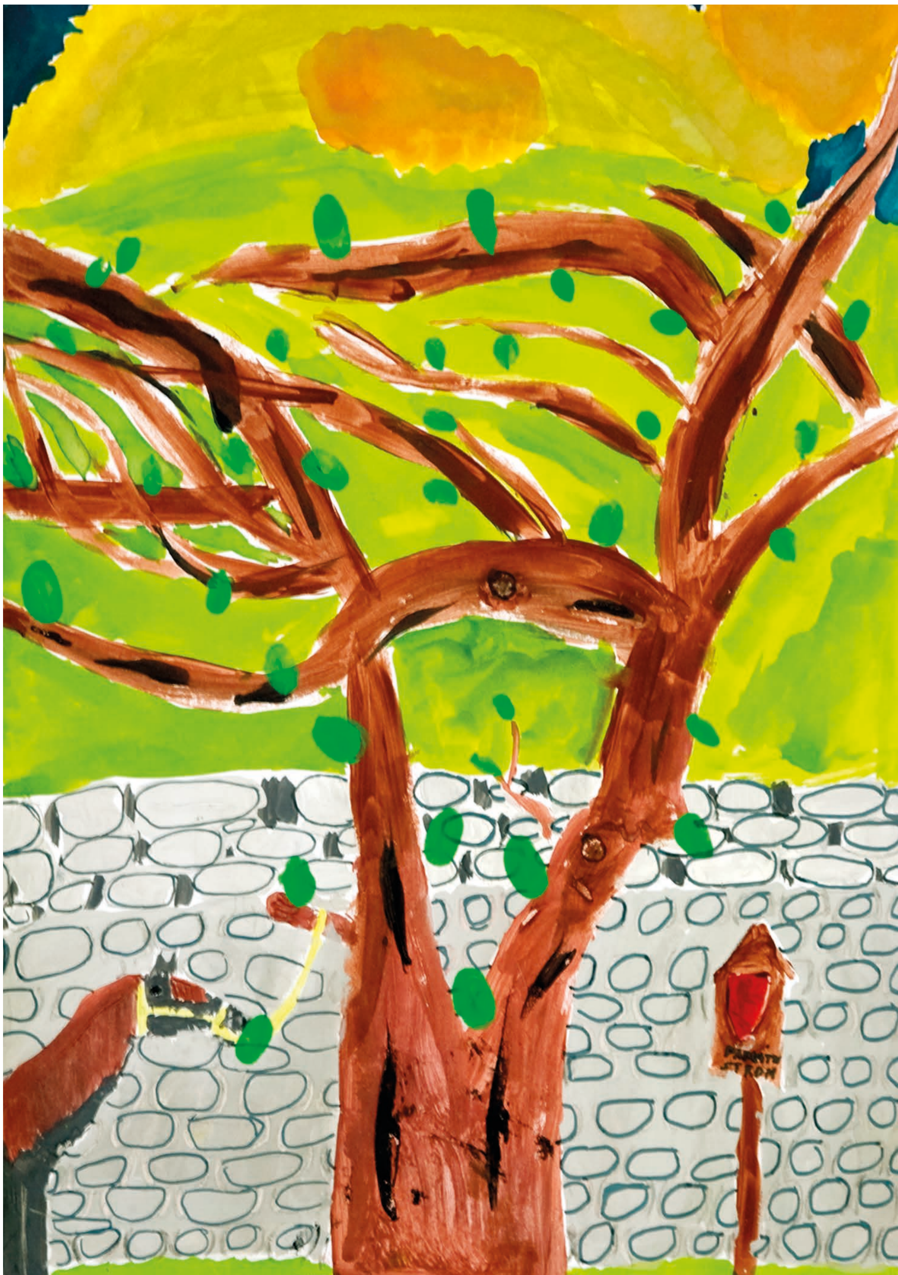
Karolína Dvořáková, 4. ročník, Okna